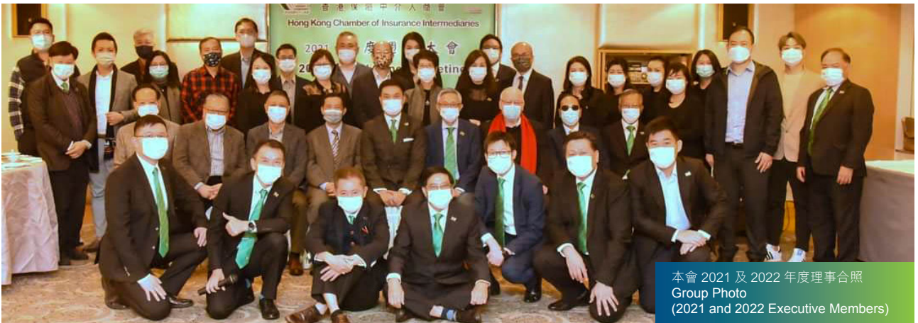
本會 2021 及 2022 年度理事合照 Group Photo (2021 and 2022 Executive Members)