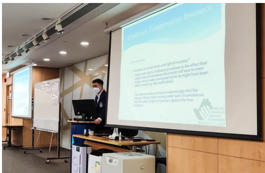
上課場地: 灣仔活道職業訓練局大樓 9 樓 VTC Tower, 9/F., No. 27 Wood Road, Wan Chai.