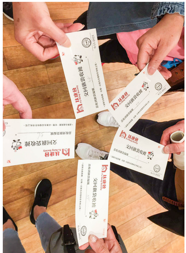
大家各展其謀，成績彪炳，令人興奮 Everyone showed their own ideas, and the achievements were brilliant and exciting.