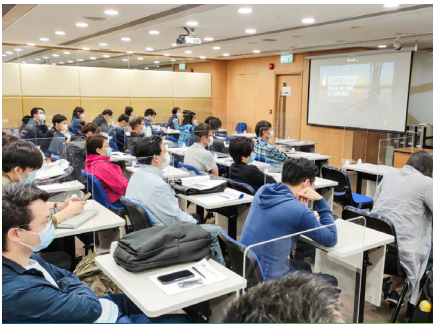
CPD 課程進行中 During CPD Class

Continuing Professional Development (CPD) - March 2021