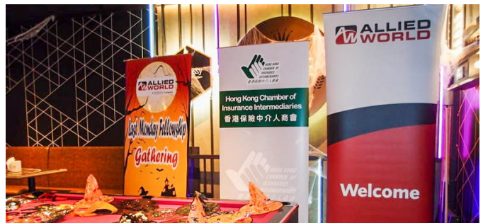
萬聖節之夜，我們悉心準備了化妝道具，加上贊助嘉賓世聯保險有限公司提供獎品，希望大家玩得盡興。 We prepared makeup props, and the sponsor Allied World Assurance Ltd. provided prizes, hope everyone has a good time.