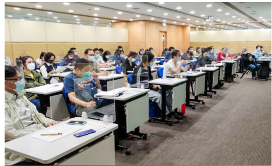
上課場地：灣仔活道職業訓練局大樓 9 樓 VTC Tower, 9/F., No. 27 Wood Road, Wan Chai.