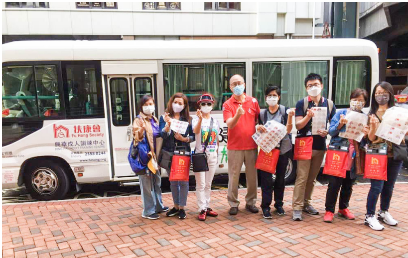
義工朋友和理事齊努力，開心做善事 Volunteer friends and directors work together to do charity