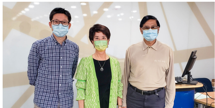
理事合照 Group photo of Committee Members