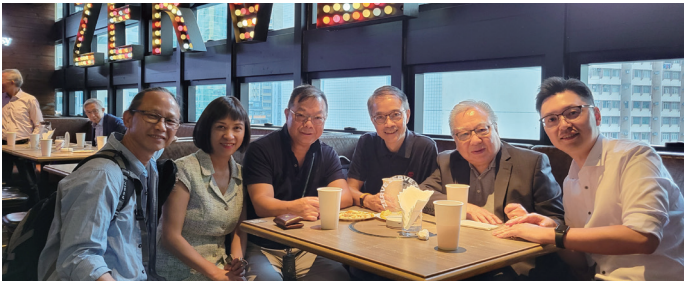
贊助商代表與會員十分融洽。 Sponsor's representative mingled with members well.