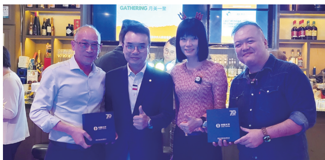
中國太平準備了豐富的抽獎禮物，為今晚增添不少歡樂。 China Taiping Insurance has prepared a variety of lucky draw gifts, adding much joy to the evening.