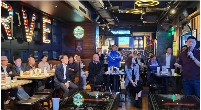
大家正在了解 QBE 的保險新產品。 Everyone is learning about QBE's new insurance products.