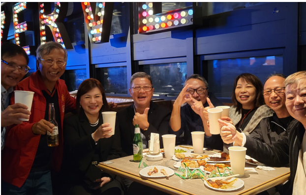
大家都為今次聚會舉杯慶祝。 Everyone raised their glasses to celebrate this gathering.