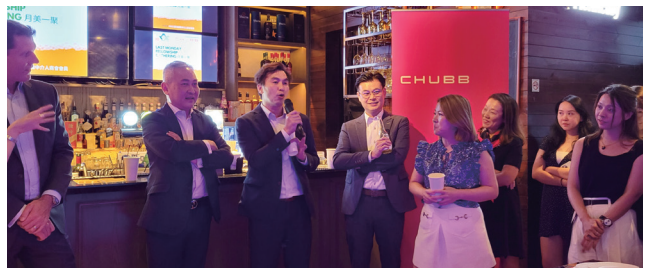
安達保險代表介紹部門同事。 Colleague introduction is made during the event by Chubb's representative.