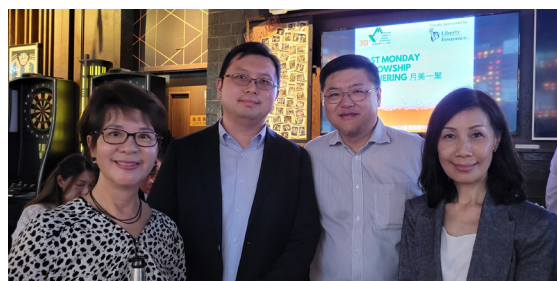
我們商會代表與利寶國際代表介紹商會活動後合照。 Photo with Liberty's representative after HKCII committee members introduced the Chamber's activities.