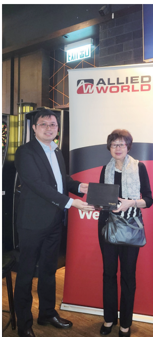
恭喜幸運大抽獎中獎幸運兒。 Congratulations to Lucky Draw Winner.