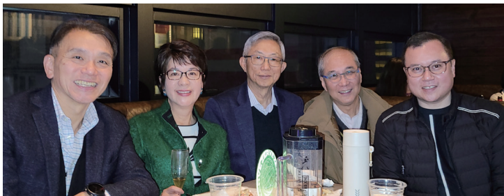
前會長們及會員與信諾環球代表合照。 Happy together with the sponsor.