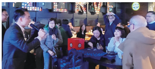
歡樂「月美一聚」現場。 Happy monthly gathering.