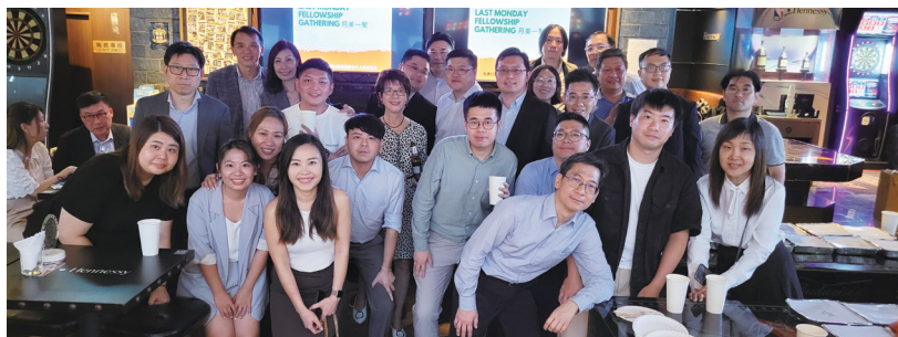
贊助商利寶國際與本會理事們大合照。 Group Photo with Sponsor Liberty International Insurance Ltd. participants & Chamber ECs.

月美一聚 Last Monday Fellowship Gathering Sponsored by Liberty International Insurance Ltd.