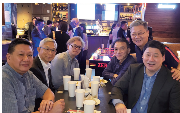
大家都在這次聚會留下美好回憶。

Everyone is listening attentively to the lecture.