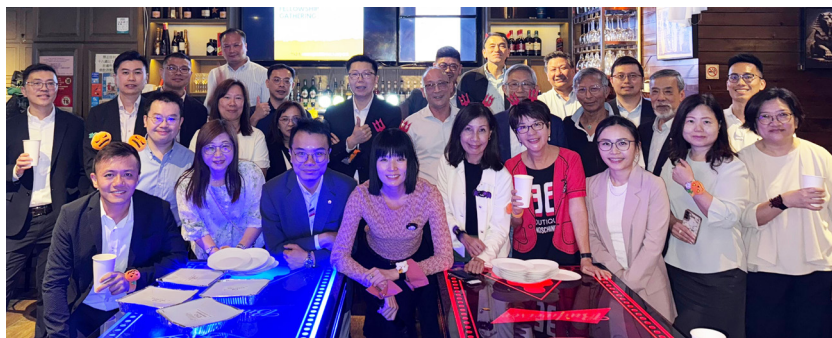
中國太平保險的團隊與本會留下美好的合照。 The team from China Taiping Insurance captured a memorable group photo with our association.

Sponsored by China Taiping Insurance (HK) Company Limited