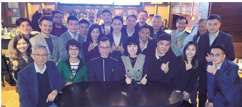
理事們與贊助商信諾同事一起大合照。 Group photo of HKCII Committee members and colleagues of Cigna, the sponsor.

Sponsored by Cigna Worldwide General Insurance Company Limited