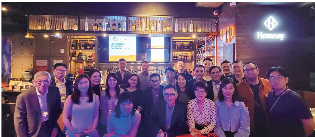
富勤保險的團隊與本會留下美好的合照。

Sponsored by Falcon Insurance Company (Hong Kong) Limited