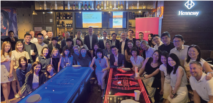
月美一聚：贊助商安達保險與商會理事大合照。 Committee Members took a group photo with the sponsor Chubb Insurance Hong Kong Ltd.

月美一聚 Last Monday Fellowship Gathering Sponsored by Chubb Insurance Hong Kong Ltd.