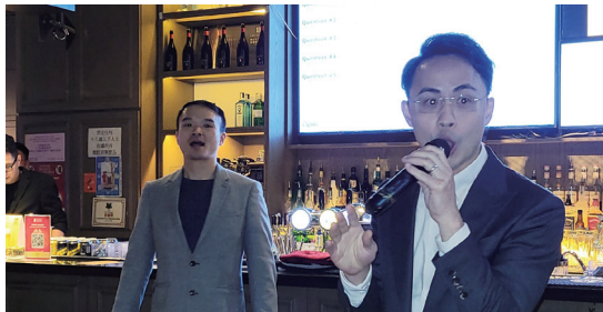
贊助保險公司“信諾環球”代表致詞。 A Speech by the representative of sponsor Cigna Healthcare.