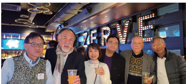
理事與會員十分融洽。 Committee members mingled with members well.