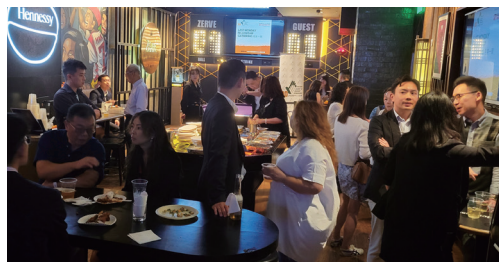
樂也融融。 Joyful and harmonious.