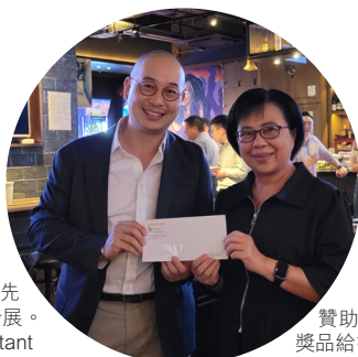
贊助商代表頒發獎品給抽獎中獎幸運兒。 Sponsor's representative presented the prize of the lucky draw to the winner.