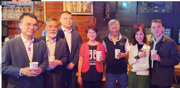
「魔鬼」與人類的合照。 A group photo of the "devil" and the humans.