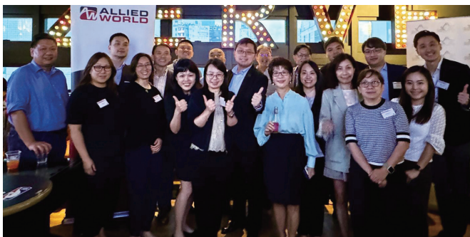
理事們與贊助商世聯同事一起大合照。 Group photo of HKCII Committee members and colleagues of Allied World, the sponsor.

Sponsored by Allied World Assurance Company Limited