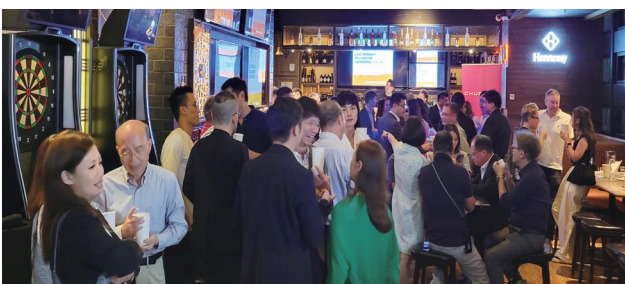
每個月尾，大家相聚傾下計。 At the end of each month, let's enjoy chat & chill together.