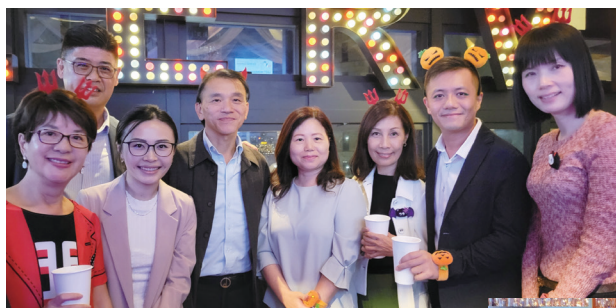
萬聖節晚上，大家都參與了換裝派對，有不少「魔鬼」和「南瓜」參加派對。 On Halloween night, everyone joined in the costume party, with many "devils" and "pumpkins" attending the celebration.