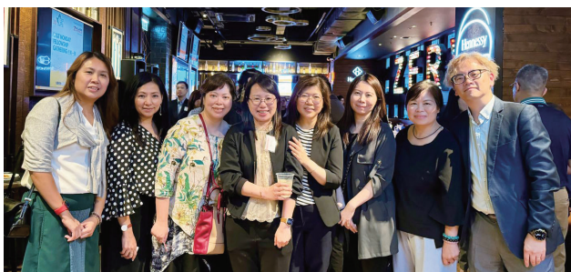
大家笑得幾開心。 Everyone has a great smile.