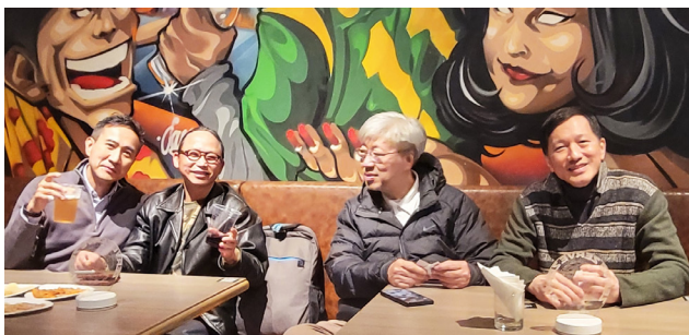
會員們享受現場環境。 Members enjoying the environment.