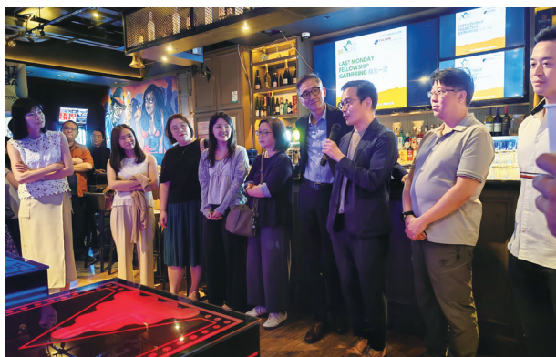
富勤保險的團隊正在自我介紹。

The team from Falcon Insurance took a wonderful group photo with our association.