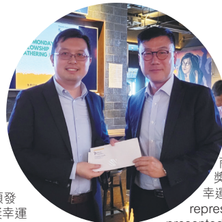
商會代表頒發獎品給抽獎中獎幸運兒。HKCII's representative presented the prize of the lucky draw to the winner.