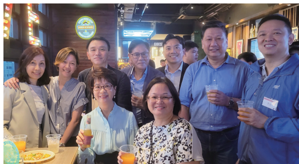
理事們與信諾環球同事合照。 Happy together with the sponsor.