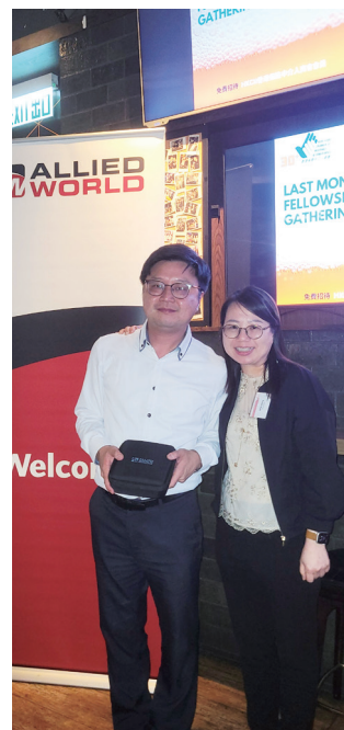
好易中好易中。 Easy to win, easy to win.