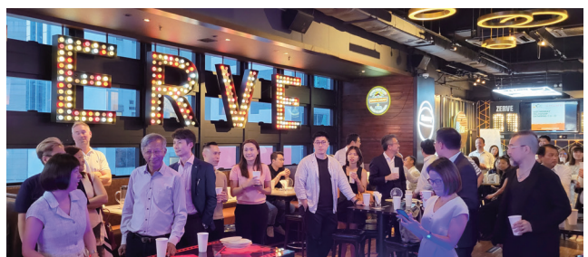
全場氣氛輕鬆大家樂也融融，把酒言歡。 Relaxed and joyful gathering with drinks.