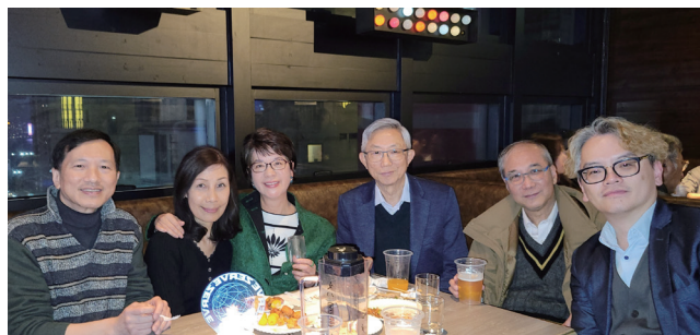
每個月尾，大家相聚傾下計。 At the end of each month, let's enjoy chat & chill together.