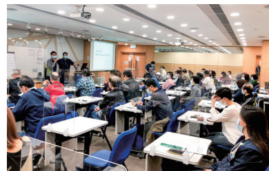
汽車保險 CPD 課程進行中 Motor Insurance Review During CPD Class