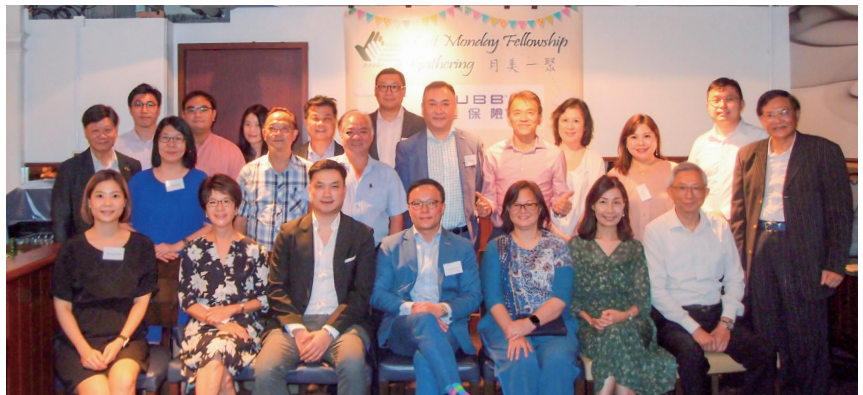
當晚精華，全體大合照。 Group Photos of Chamber Committees & CHUBB Colleagues