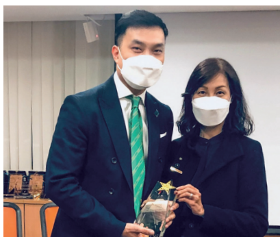
致送紀念品及合影 Souvenir Presentation and Group Photo