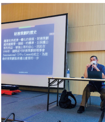
線上參加者的景觀 View of Online Participants