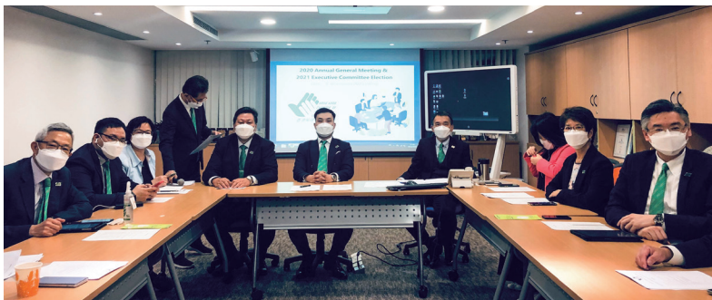
香港保險中介人商會 2020 會員週年大會 HKCII 2020 Annual General Meeting