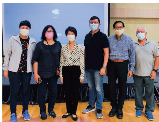
理事及工作人員合照 Group photo of Committee Members and Staff