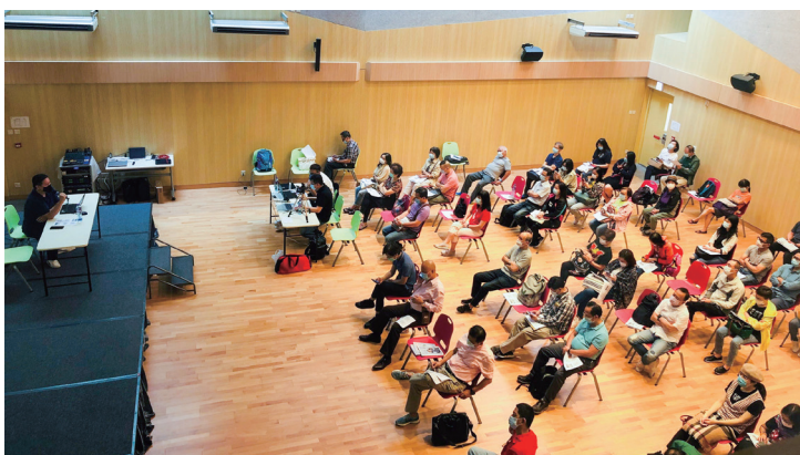
新場地：油尖旺多元文化活動中心 New Venue: Yau Tsim Mong Multicultural Activity Centre