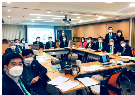
香港保險中介人商會 2020 會員週年大會 HKCII 2020 Annual General Meeting