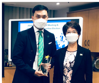
致送紀念品及合影 Souvenir Presentation and Group Photo