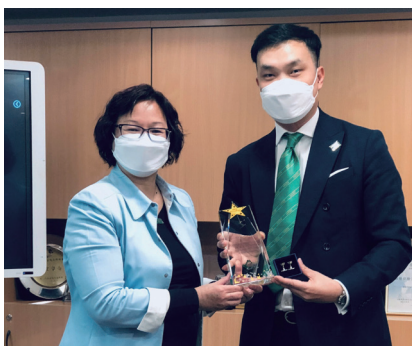
致送紀念品及合影 Souvenir Presentation and Group Photo