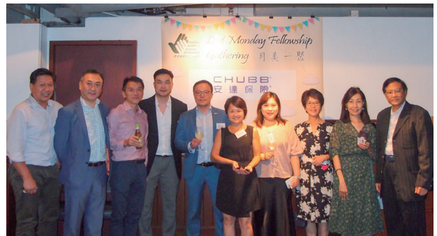
安達保險公司會同本理事們及會長大合照。 Group Photo with CHUBB participants & Chamber ECs