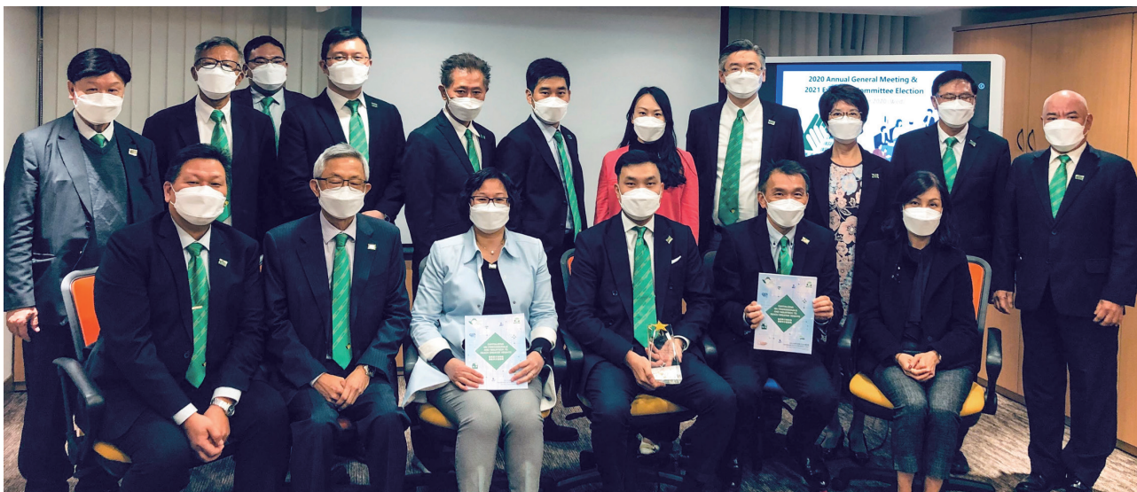
香港保險中介人商會 2020 執委會合影 HKCII 2020 Executive Committee Group Photo