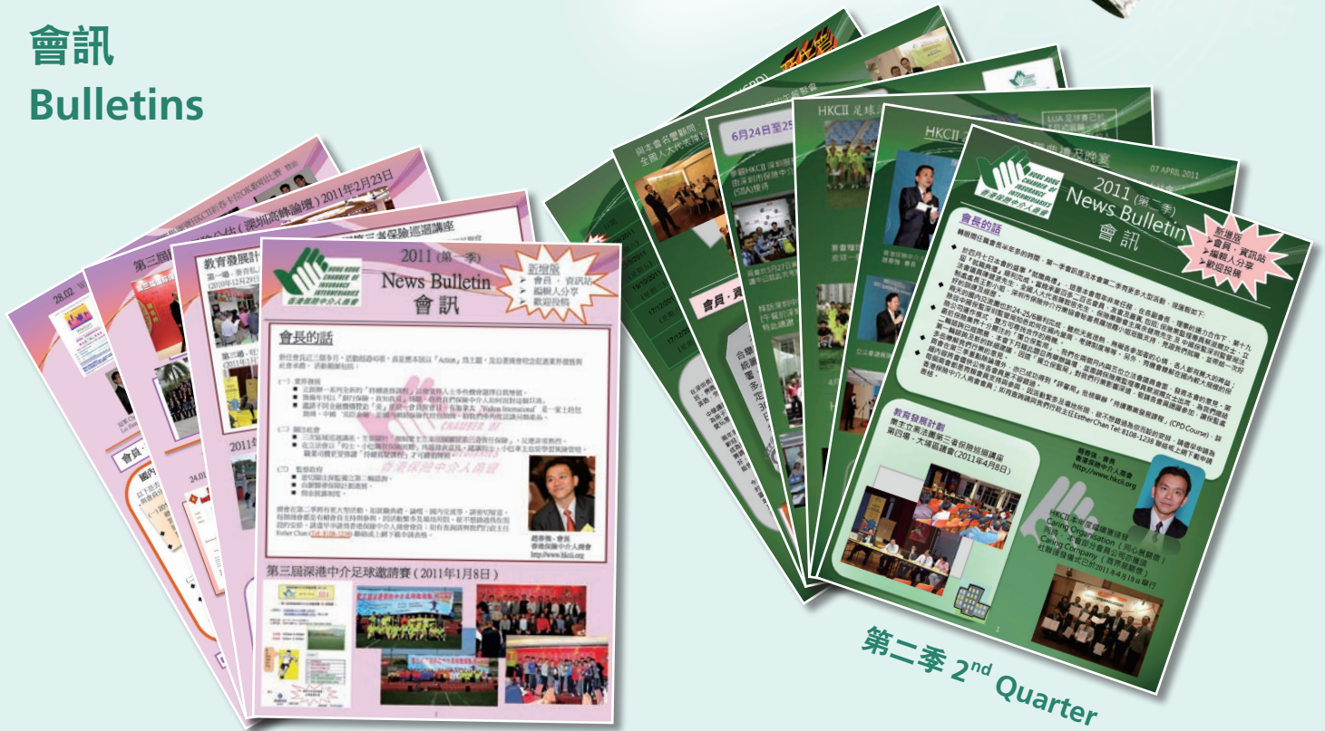
第一季 1 st Quarter