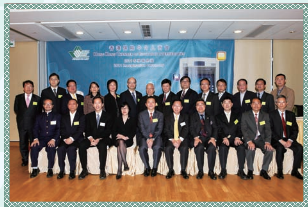
主禮嘉賓與2011年度理事局成員合照 2011 Board of Directors photo with Officiating Guests