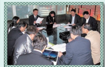
理事會每月會議 Monthly Board meeting