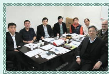
就職禮籌委會會議 Inauguration Subcom meeting