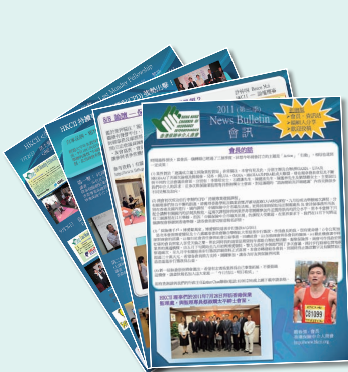
第三季 3 rd Quarter