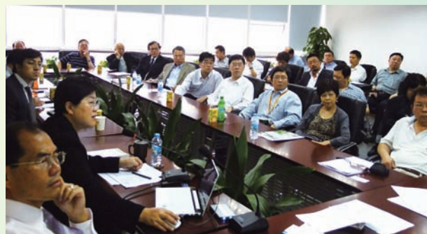
“深港保险中介服务中心”首次联合培训——“中国保险中介市场及法规培训”

网站： www.siia.com.cn 电邮： sz-siia@163.com 电话：(86-755) 82947196 83067675 传真：(86-755)82909140 地址：深圳市福田区红荔路与新洲路第一世界广场A座24楼