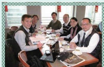
年刊籌委會會議 Yearbook Subcom meeting