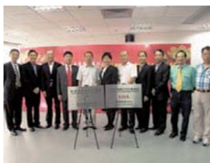
▲ “深港保險中介服務中心” 揭牌儀式