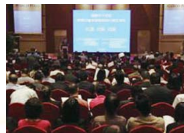
▲ 保險中介論壇暨第四屆深港保險經 代銷交流會