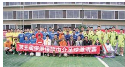
▲ 第五屆深港保險中介足球邀請賽