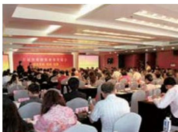
▲ 首屆深港銀保業務交流會