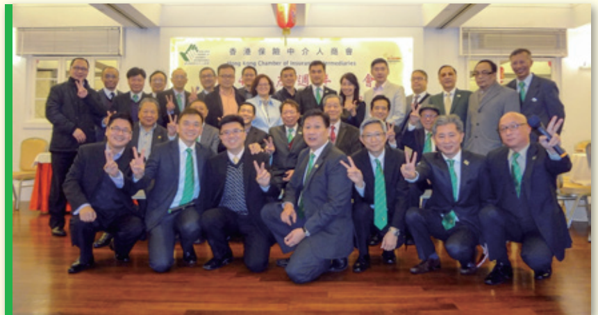
▲ 理事與會員合照 Photo of Executive Committees and Members