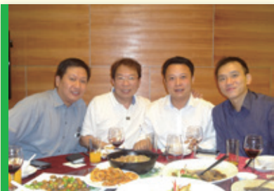
▲ 與中華保險商務午餐 Business lunch with China United Insurance Holding Company