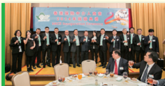
▲ 理事祝酒 Toast by Executive Committees