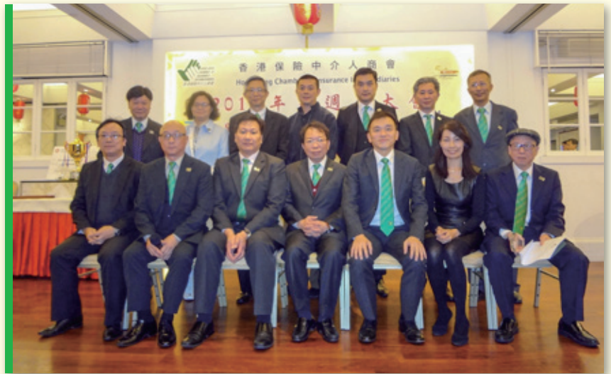
▲ 全體理事合照 Group photo of Executive Committees