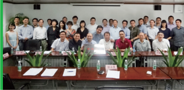
▲ 深圳市保險中介行業協會及交流團全體會員與13家保險公司代表合照 Group photo of SIIA, HKCII members and the representatives from insurance companies