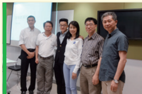
▲ 眾導師在課堂後合照 Group photo of guest speakers and Directors from HKCII