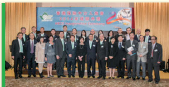
▲ 理事及嘉賓合照 Group photo of Executive Committees and Guests