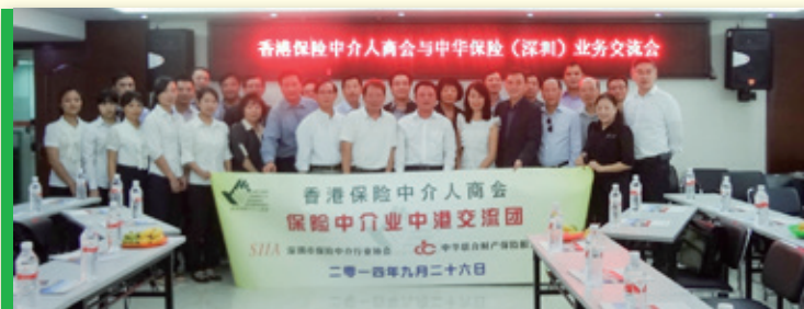
▲ 交流團全體會員與中華保險國際部同事合照 Group photo of HKCII members and the colleagues of China United Insurance Holding Company