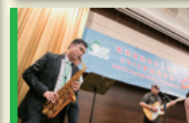
▲ 奏樂表演 Guests playing music