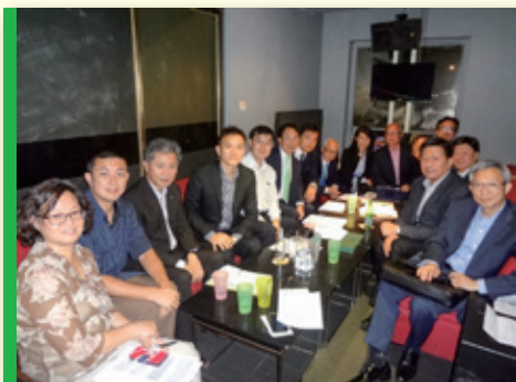
▲ 每月理事會議 Monthly Executive Committee Meeting