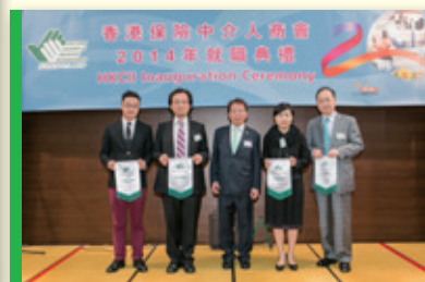
▲ 會長頒發感謝狀 President presenting Certificate of Appreciation