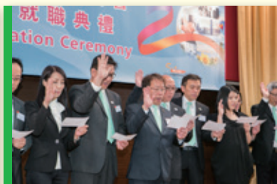
▲ 理事宣誓 Oath by Executive Committees