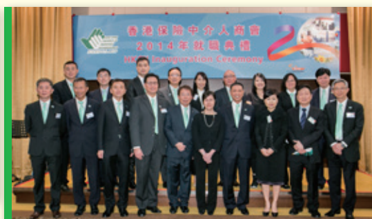
▲ 理事合照於就職典禮 Group photo of Inauguration Ceremony of Executive Committees