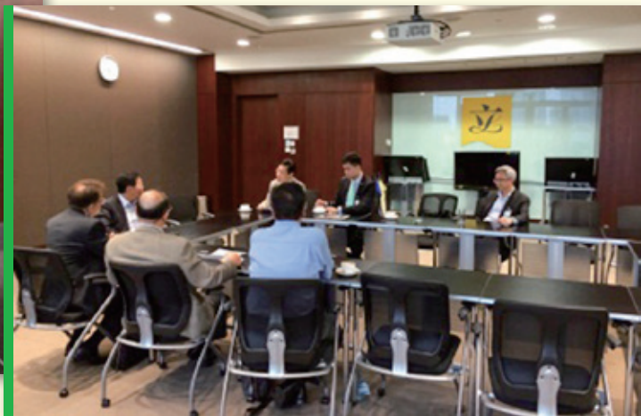
▲ 香港保險中介人商會獨立保監專責小組與陳健波議員於立法局舉行會議 HKCII IIA Task Force meeting with Hon Chan Kin-por in Legislative Council

與前會長及本會顧問舉行每月午餐例會 Regular lunch meeting for HKCII Past Presidents and Counsellors