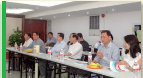
▲ 交流團熱烈提問合作細節共覓商機 To Explore the business opportunities together