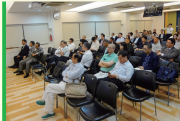
▲ 到場會員及友會嘉賓 HKCII members and the representatives from friendly associations