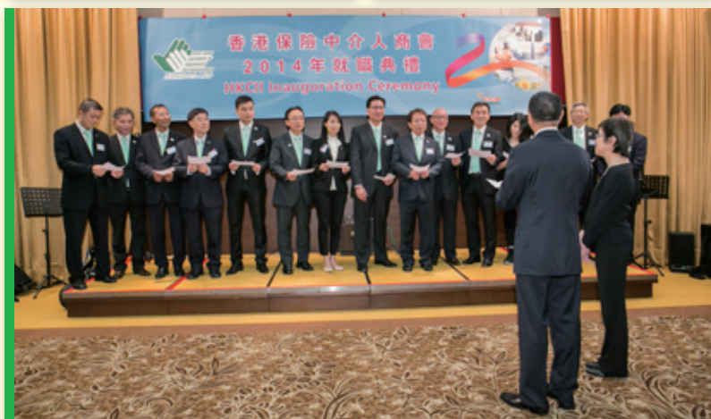
▲ 保監專員及創會會長主持監誓 Administration of Oath by Commissioner of Insurance and Founding