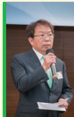
◀ 會長致辭 President Speech