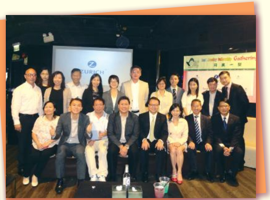
▲ 眾志成城 Successful crowd