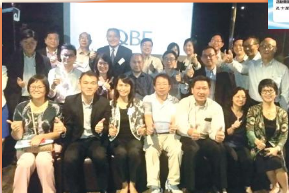
▲ 嘩！人山人海 All packed for the photo