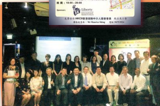
▲ 感謝您們多年慷慨的支持！ Thank you Liberty International Underwriters for your kind support!