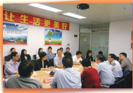
▲ 與中國人民人壽保險股份有限公司交流中港保險資訊 Meeting with PICC & HKCII