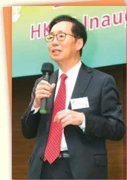
▲主禮嘉賓立法會議員 陳健波先生致詞 Mr KP Chan of Legislative Council