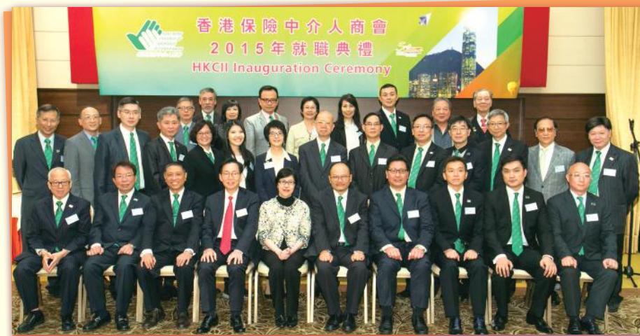
▲理事及嘉賓合照 Group photo of Executive Committees and Guests