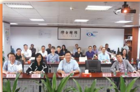
▲ 深圳市保險中介行業協會 HKCII group photo at SIIA