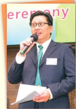
▲會長歡迎各位出席者 President's Welcoming Speech