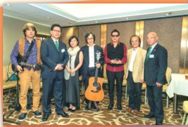
▲ 帶來精彩演出的表演嘉賓 Artistes who brought a wonderful performance to the night