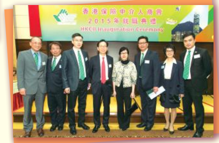
▲2015年度理事與主禮嘉賓合照 Group photo of Executive Committee and special guest