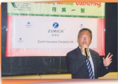
▲ Ricky在唱歌？ Is Ricky singing?