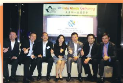
▼ 感謝您們多年慷慨的支持! Thank you for your kind support!