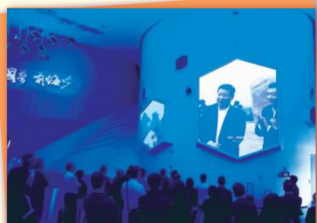
▲ 聽國家主席習近平評論的“前海發展” Listening to President Xi Jinping comment on the development of "Qian Hai"