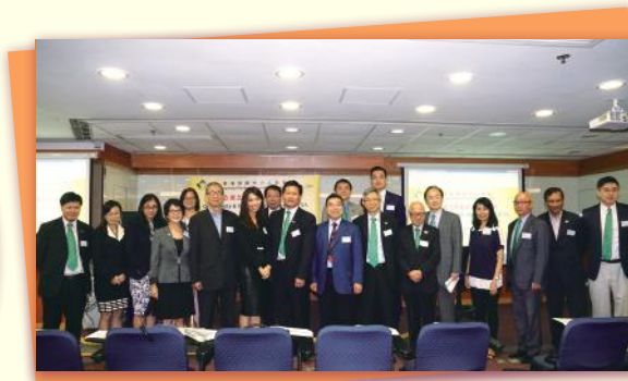
▲ 會後合照 Accomplishment photo