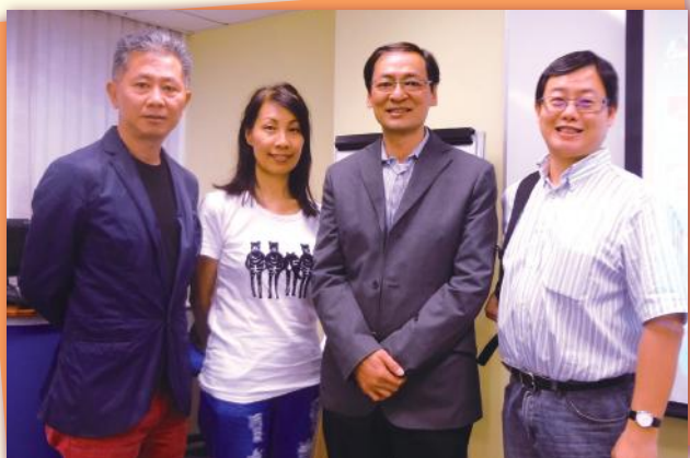
▲ 課堂後合照 Group Photo with Lecturer & HKII Directors