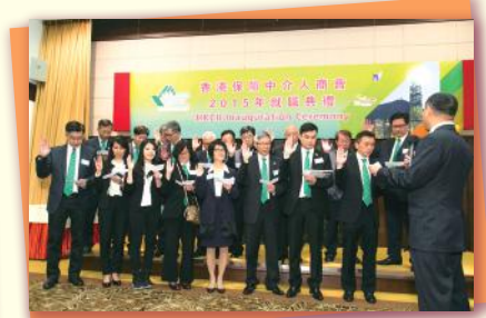
▲理事宣誓 Oath ceremony of Executive Committees