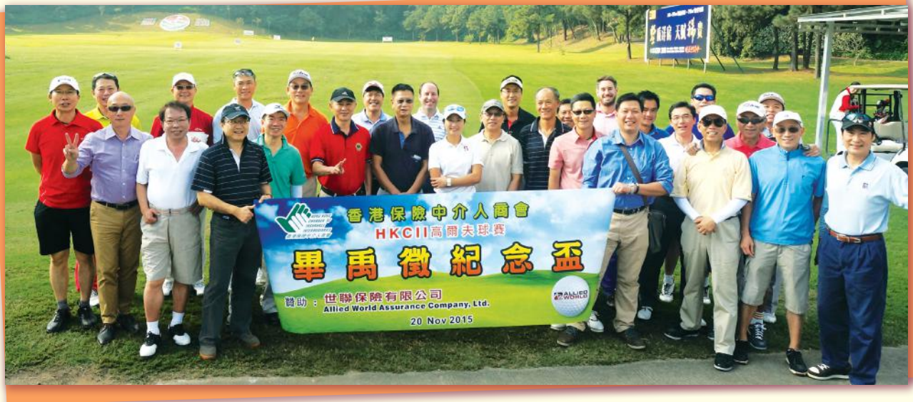
▲發球前大合照 Group Photo before Tee off