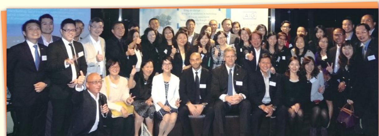
▲ 嘩！賓墟咁場面！ What a big party!