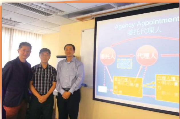
▲ CPD理事與CPD導師合照 Director of CPD & Lecturers