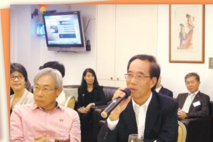
在提問環節，各嘉賓都踴躍提出問題或見解 Guests are eager to raise questions and opinions at the Q & A session