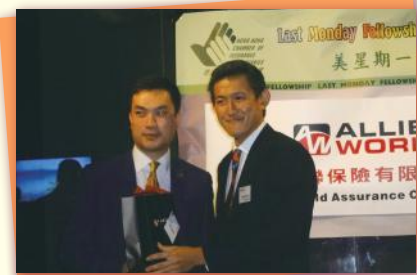
▲ CE 發表業務大計 Chief Executive is delivering business plans