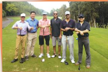
▲果嶺團體照▲ Group photo on the field