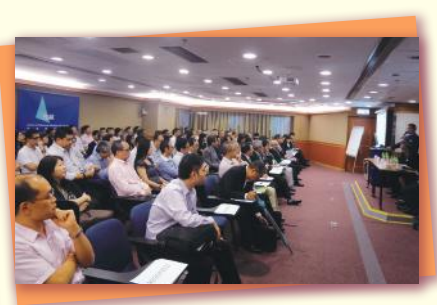
▲ 全會場坐滿，特別感謝VTC免費借出場地 Special thanks to VTC sponsoring venue, achieving full house for the forum