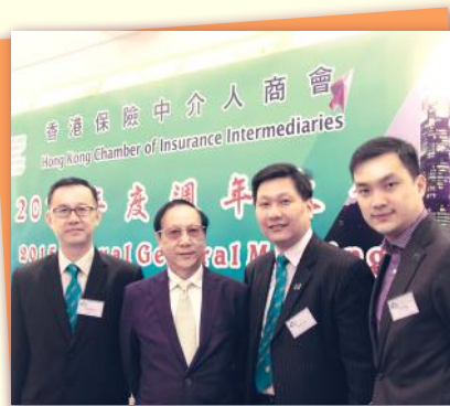
▲會員週年大會 ▲ Annual General Meeting (12/2015)