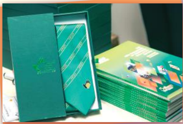
▲ 本會第二十屆就職典禮紀念品及年刊 The souvenir of 20th Inauguration and Yearbook