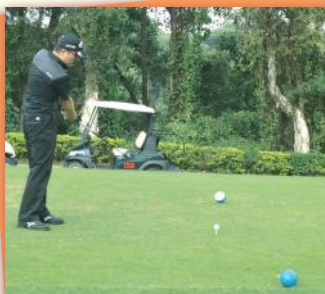
▲老鷹·小鳥盡在此桿 Eagle or Birdie all matter of this putt