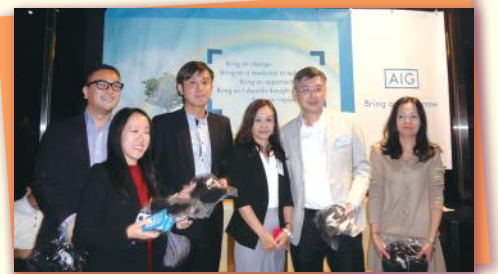
▲ AIG 贊助兼有獎品 Sponsor AIG gifts