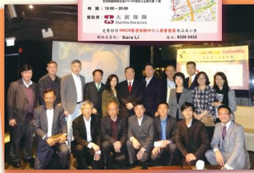
▲ 笑容滿面 Everyone is delightful