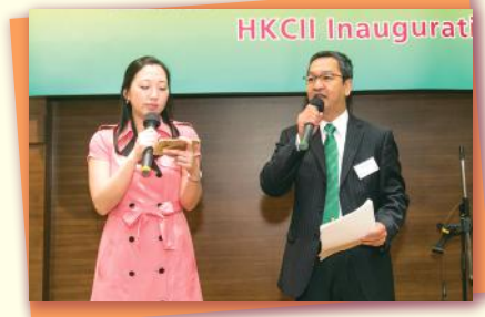
▲司儀 Master of Ceremony