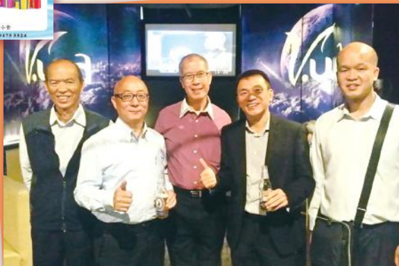
▲ 笑容滿面 Such a happy evening