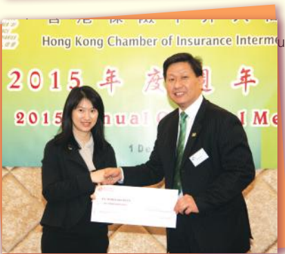
▲會長奉上支票支持扶康會 President presenting cheque to support Fu Hong Society