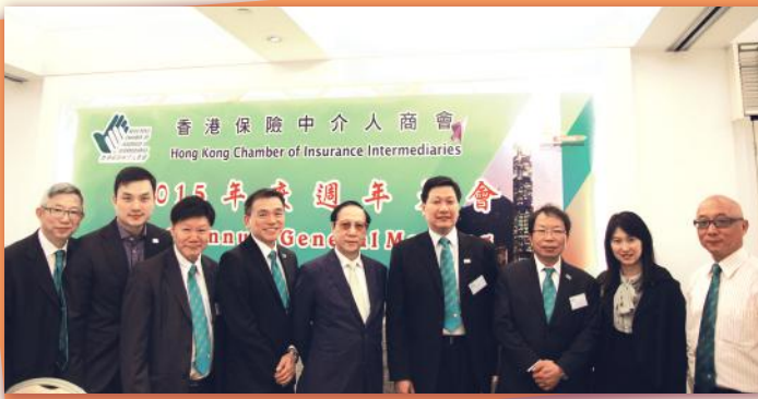
▼全體理事合照 Group Photo of Executive Committee