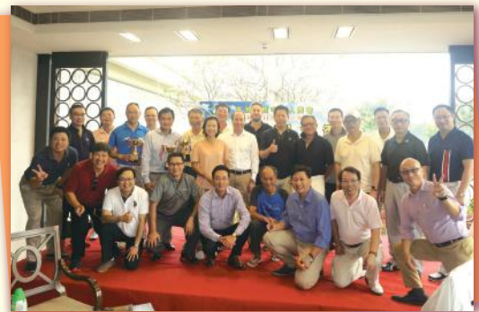
▲賽後大合照 Group Photo after tournament