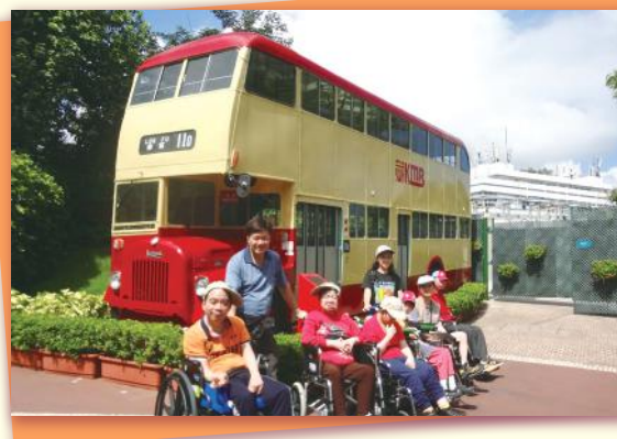
在海洋公園太陽下合照 Group photo under the sun at Ocean park