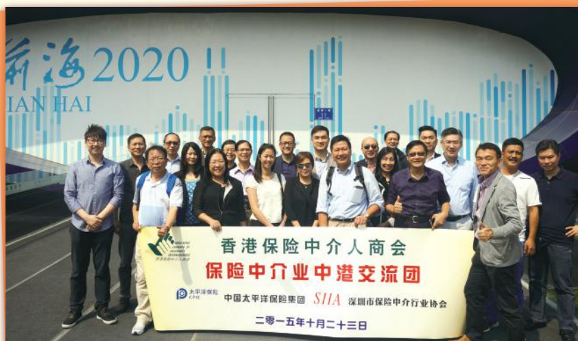
▲ 前海展覽館 Group photo visiting new developing business district "Qian Hai"