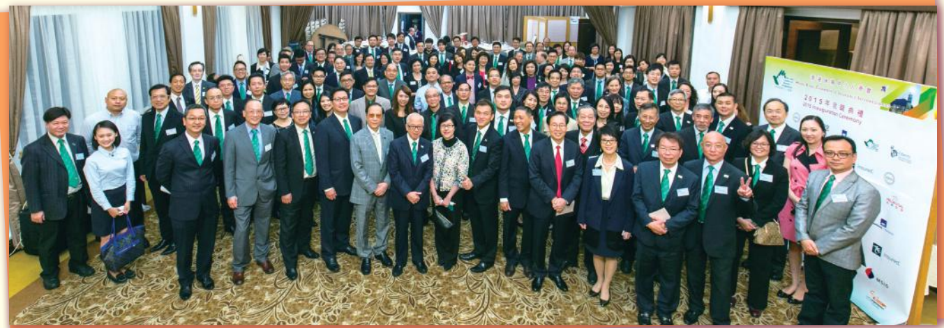
▲ 大合照 Group photo of all participants