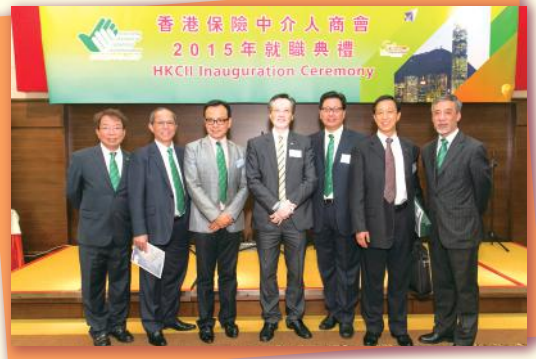
▲ 與澳門友會合照 Group photo with Macau insurance association