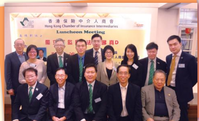
▲ 完結後與各嘉賓大合照 Group photo with guests at the end of the session