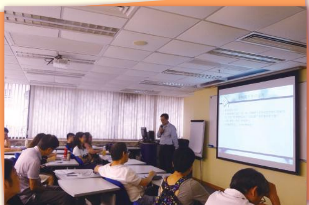
▲ 學員在上課中 Participants attending CPD course