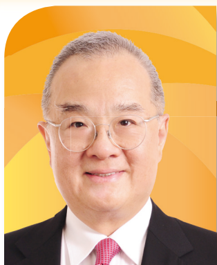
鄭慕智博士 大紫荊勳賢，GBS，JP