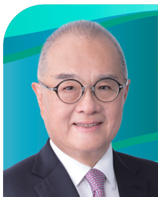
鄭慕智博士 大紫荊勳賢，GBS，JP