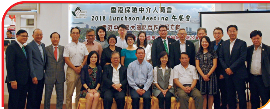
會議後來一張大合照 Group Photo after the event with all the honorable guests and participating ECs