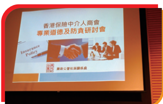
◎ 本會與ICAC合辦持續專業發展課程之專業道德及防貪研討會 HKCII organized a CPD course with the assistance of ICAC which offered free ethics training and consultancy services