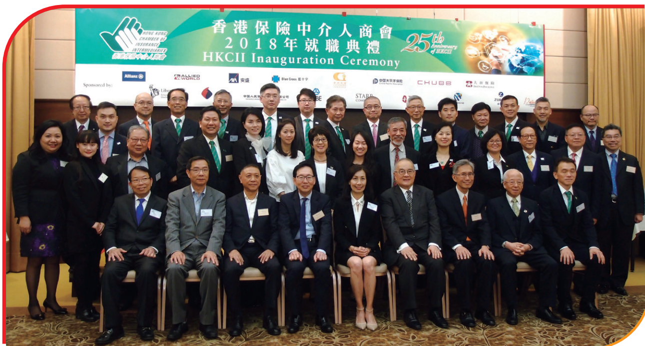
● 新一屆理事與監誓嘉賓大合照 Group photo of EC members, past presidents, Councilors and honorable Guests