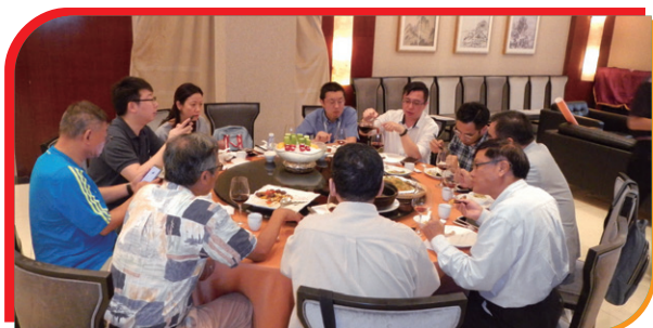
③ 中民保險網股份有限公司宴請本會午宴 Zhongmin Insurance Network Co., Ltd. hosted a luncheon for the Chamber