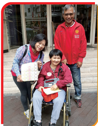
HKCII參加扶康會賣旗活動，籌到很多捐款。 HKCII Volunteers joined the Fu Hong housemate to participate in Flag Selling fund raising activity.