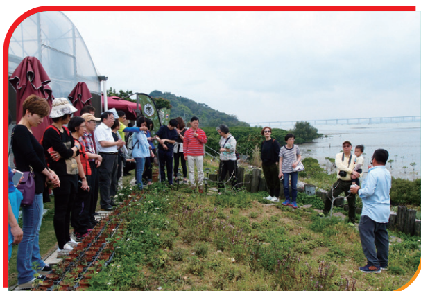
永霖水耕菜農場，認識流浮山環保種植新科技。 Briefing on the Organic Hydroponics farming and the environment