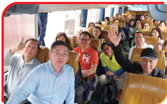
出發兩大旅遊車 2018 Spring Tour~ full house for 2 coaches

4/3/2018 (星期日) HKCII舉辦一年一度之新春行大運，亦是本屆理事與各會員及友好相聚的好日子，參觀永霖水耕菜農場、午餐於蓬瀛仙館品嚐殿堂級齋菜，大家歡樂團圓滿載而歸，過一個開心嘅一天！