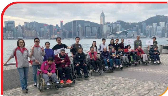
HKCII participated in FHS "Walk-In" Charity Walkathon