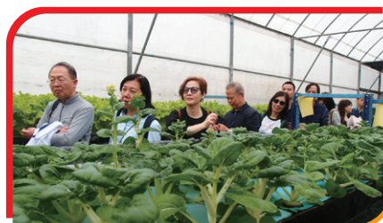
參觀水耕温室 Inside the hydroponics green house