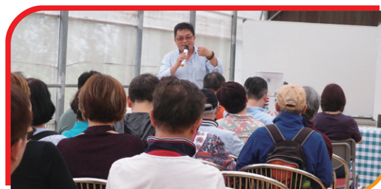
專心學習，水耕種植，田園綠野耕種方法。 Participants listened attentively to learn the Organic Hydroponics details