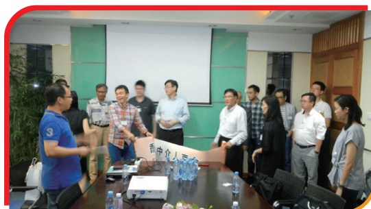
⑥ 介紹中國太平洋財產保險股份有限公司(深圳分公司)的運作模式 Introducing the operations of China Pacific Property Insurance Company Limited (Shenzhen Branch)