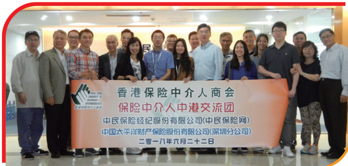
① 中民保險網股份有限公司 Zhongmin Insurance Network Co., Ltd.