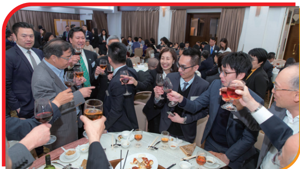
嘉賓們都非常支持香港保險中介人商會 President made a toast with the honorable guests