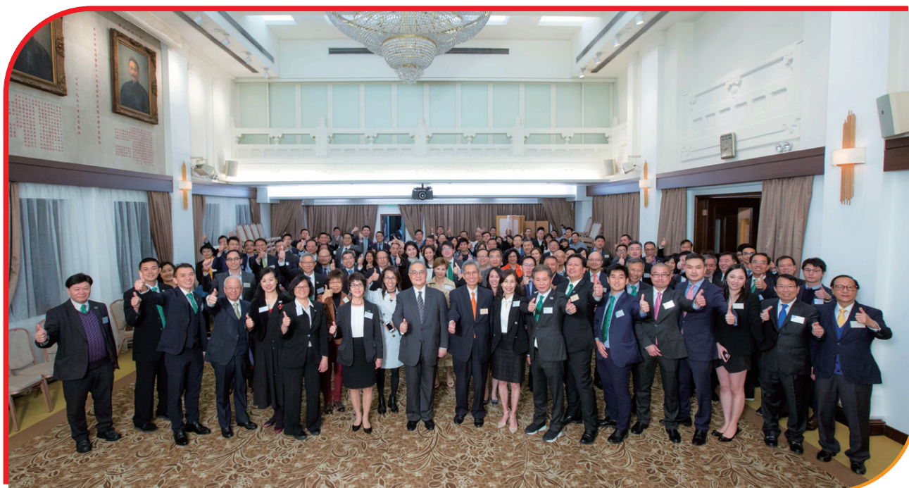
● 嘉賓們來一張大合照 Grand Photo of all participants in the ceremony