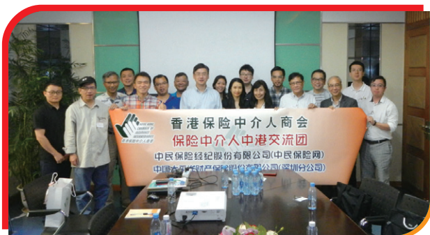
⑤ 中國太平洋財產保險股份有限公司(深圳分公司) China Pacific Property Insurance Company Limited (Shenzhen Branch)