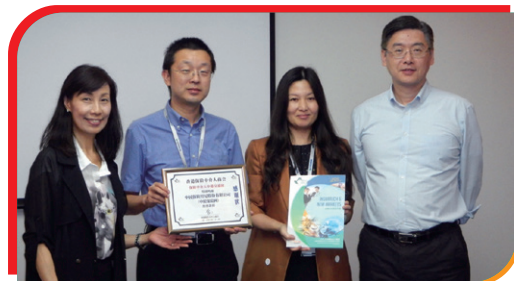
② 致送紀念狀和本會年刊留念 Presented a souvenir and the annual publication of the Chamber