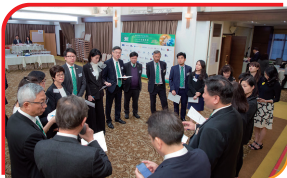
大會開始之前理事們都認真地複習一次流程確保順利進行 Short briefing for the ceremony run-down and distribution of works to each EC