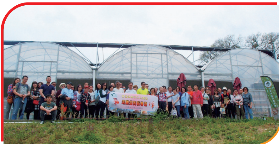
永霖水耕菜農場大合照 Group Photo in front of the hydroponics green house.