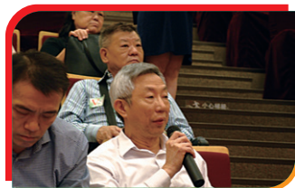
◎ 課程進行中，ICAC介紹防貪，誠信培訓 During the CPD course, ICAC delivered anti-corruption and ethics training