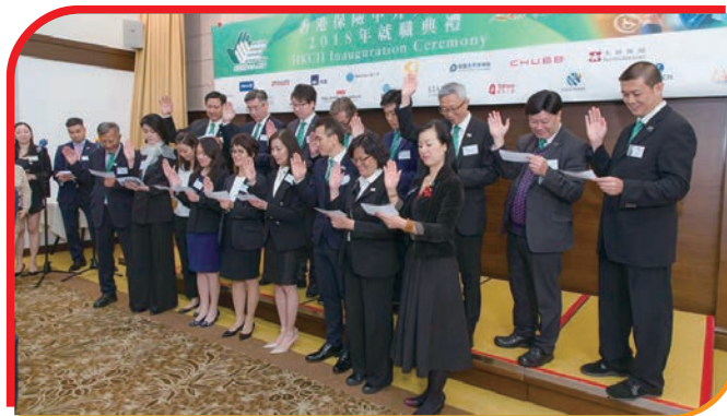
莊嚴而隆重的宣誓儀式 Full committee members took the Oath solemnly during the ceremony