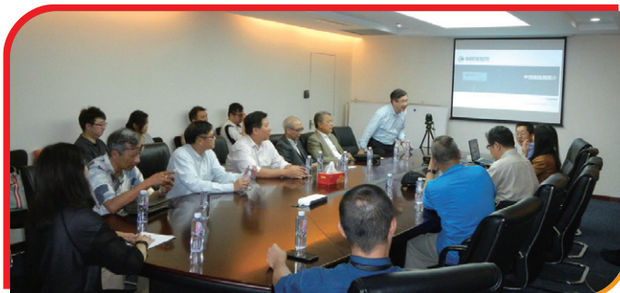
④ 介紹中民保險網的運作模式 Introducing the operations of Zhongmin Insurance Network